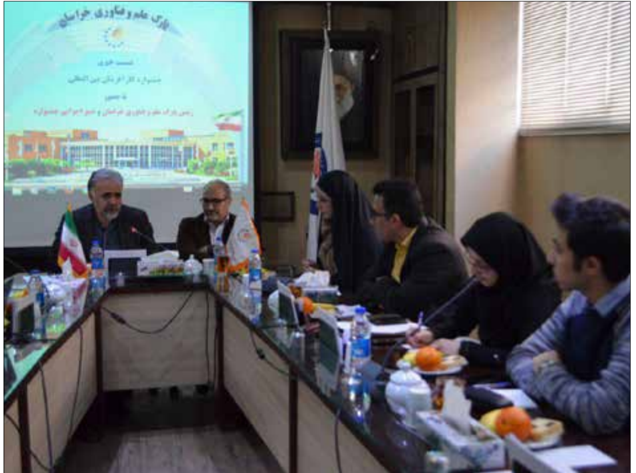
رئیس پارک علم و فناوری خراسان خبر داد:

وی در پایان گفت: افزایش جذابیت‌های طرح و نوآوری موجود، سرمایه‌گذاری بر روی ایده‌های نو، تقویت تیم R&D و افزایش تبلیغات را از بهترین اهداف شرکت بزرگمهر منیر سورن برشمرد. “