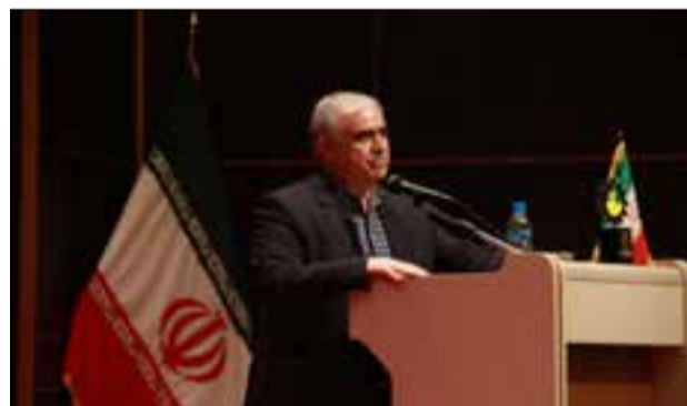
مهندس پرویزی استاندار خراسان جنوبی

اقتصاد و معیشت مردم شاهد خواهیم بود. در پایان از ادارات کل تعاون، کار و رفاه اجتماعی، راه آهن شرق کشور و شرکت آب منطقه‌ای استان به عنوان دستگاه‌های اجرایی برتر، شرکت‌های فناور و دانش بنیان دانشجویار خاوران، زیست سپیدان حیات پایا و فروهر فناور کوروش به عنوان شرکت‌های دانش بنیان برتر، دانشگاه‌های آزاد اسلامی واحد بیرجند و علوم پزشکی و خدمات بهداشتی و درمانی بیرجند به عنوان مراکز پژوهشی برتر و واحدهای صنعتی شمش فلز منیزیم رویال فردوس، درنمای شرق و چاپ مینای سرخ شرق به عنوان واحدهای صنعتی برتر استان تجلیل به عمل آمد. ۶۶