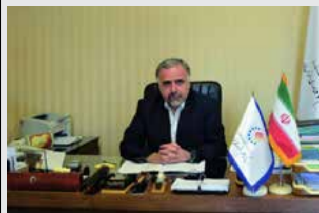
رئیس پارک علم و فناوری خراسان رضوی خبر داد