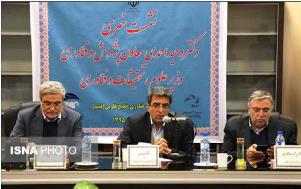
معاون پژوهش و فناوری وزیر علوم:

تیمی متشکل از رئیس‌ان ۳۹ پارک فناوری کشور و مسئولان مراکز رشد به سرپرستی معاون پژوهش و فناوری وزیر علوم، تحقیقات و فناوری برای شرکت در پانزدهمین همایش سالانه مشترک روسای پارک‌های علم و فناوری و مراکز رشد کشور در استان هرمزگان و به میزبانی پارک زیست فناوری خلیج فارس طی دو روز چهارم و پنجم اسفندماه در قشم حضور دارند. ۶۶